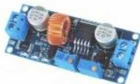
Это аналогичный вариант только в другом исполнении (синяя плата)